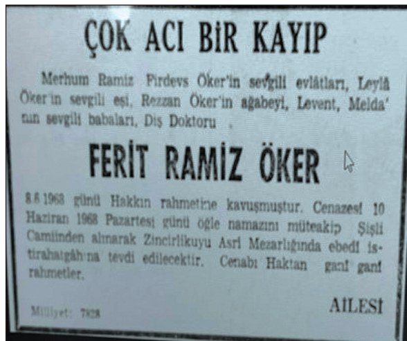
RESİM 2: Ölüm ilanı. 7