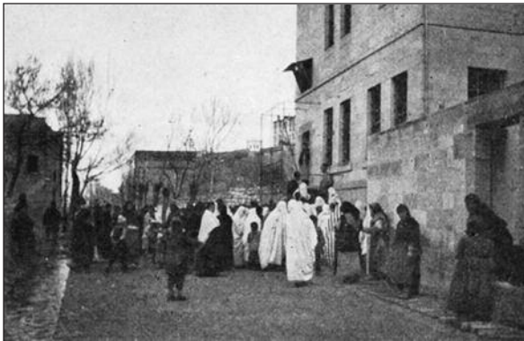
RESİM 1: Talas Nute Hastanesi dispanser girişi.

Türkçe yer ve kişi isimleri ile bazı durumlar hakkında halkın kullandığı ifadeler alınan notlarda aynen yansıtılmıştır. Buna örnek olarak;