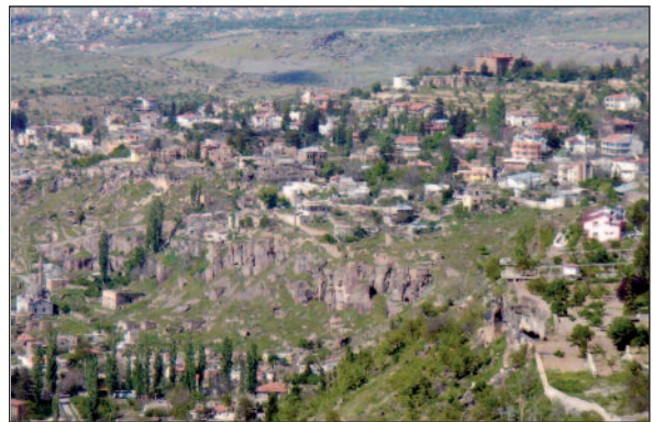
RESİM 3: Talas'ta eski yerleşim yerlerine ait kayalık yapılanma.

Fiziksel çevre şartları bazıları için oldukça zorlayıcıdır; henüz mağaralarda ya da kaya içerisine oyulmuş evlerde yaşayanlar vardır. Yaklaşık elli yıl geçmiş olmasına rağmen Kayseri'nin Talas ilçesi ve diğer bazı bölgelerinde içerisinde oturulmamasına rağmen bu tarz yaşam alanlarının kalıntıları halen varlığını sürdürmektedir (Resim 3). Yaşam alanının fiziksel yetersizlikleri yanında sağlıklı ortam ile ilgili çok sayıda çarpıcı örneğe yer verilmektedir. Muayene için gelen hastalar muayene sırası beklerken poliklinik önünden geçen bağ bahçe sulamada kullanılan akarsuda çamaşırlarını yıkayıp poliklinik duvarına asarak kurutmaktadırlar (Resim 1). Hastalardan herhangi bir nedenle idrar örneği istendiğinde laboratuarda yere oturarak numune kabını dolduranlar görülebilmektedir. Hastanede yatan hastaların yakınları ortaya çıkan tıbbi atıklardan doğrudan hasta odasında atığı yere atarak