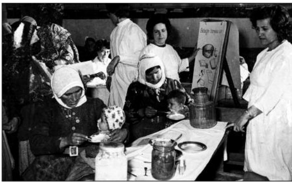
RESİM 5: Bebek beslenmesi eğitimi.

İnfertilite nedeniyle daha önce yapılan; karın üzerinde kızgın kavanoz gezdirilmesi, ağızdan çeşitli hayvanların spermlerinin içilmesi gibi yöntemlerden bahsedilmektedir. Çok ilginç bir infertilite baş-